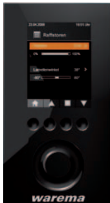
Bediengerät: Farbvariante Schwarz