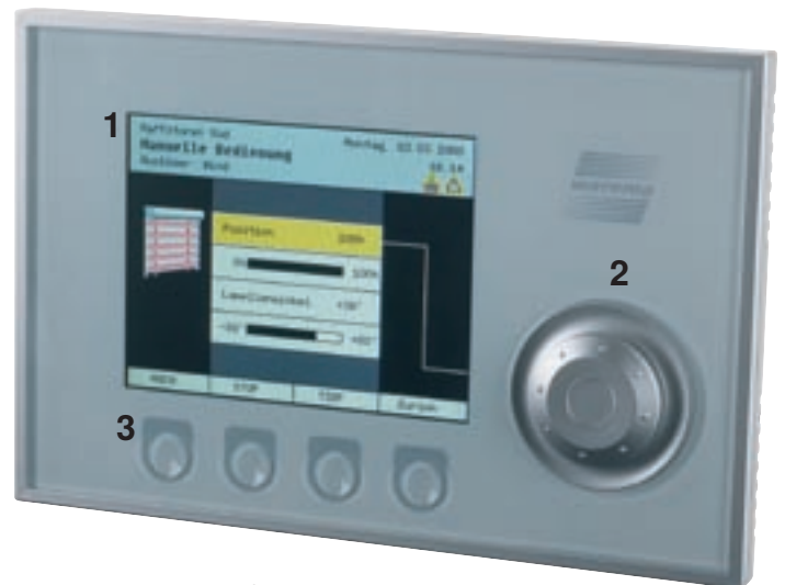
WAREMA climatronic® Bediengerät Variante: Grau/Silber

Die WAREMA climatronic® ist eine Komplettlösung zur Steuerung aller WAREMA Produkte und zusätzlichen Gewerken in Ihrem Gebäude. Egal zu welcher Jahreszeit, die WAREMA climatronic® reduziert den Energieverbrauch und sorgt immer für ein angenehmes Klima. Hierzu müssen Sonnenschutz, Lüfter, Fenster, Heizung, Kühlung und vieles mehr ineinander greifen um auf witterungsbedingte Einflüsse von außen zu reagieren.