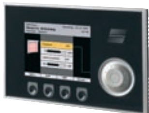
WAREMA climatronic® Bedien- gerät Variante: Schwarz/Silber