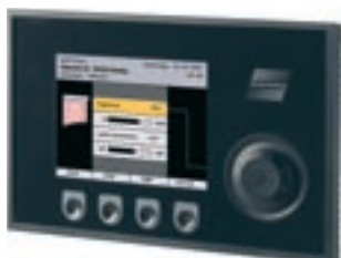
WAREMA climatronic® Bedien- gerät Variante: Schwarz/ Schwarz