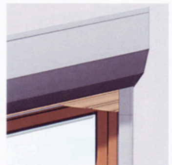
kein störender Panzerüberstand