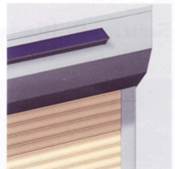
optional mit Solarantrieb möglich